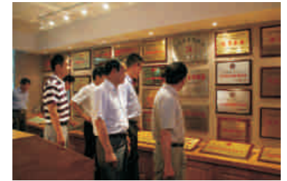
江苏省文明单位考核组一行

6月19日，江苏省文明单位考核组一行，就我公司创建2010-2012年度江苏省文明单位工作进行现场实地考察。